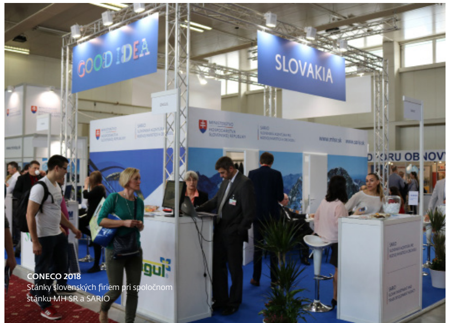
CONECO 2018 Stánky slovenských firiem pri spoločnom stánku MH SR a SARIO

Kontaktovaním SARIO na adrese trade@sario.sk začína SARIO riešiť Váš dopyt.