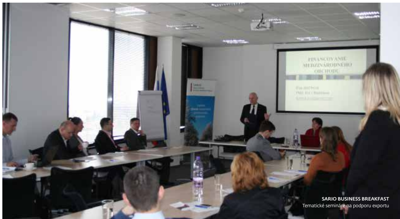
SARIO BUSINESS BREAKFAST Tematické semináre na podporu exportu

Slovenská agentúra pre rozvoj investícií a obchodu zabezpečuje komplex služby pre slovenských exportérov, firmy aj zahraničných záujemcov o slovenskú produkciu a výrobnú spoluprácu.