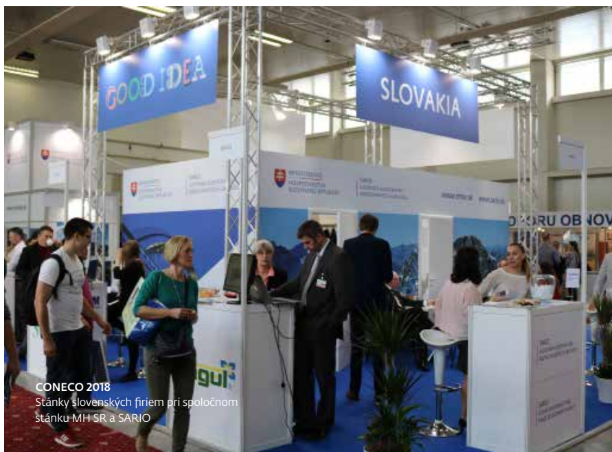
CONECO 2018 Stánky slovenských firiem pri spoločnom stánku MH SR a SARIO

Kontaktovaním SARIO na adrese trade@sario.sk začína SARIO riešiť Váš dopyt.